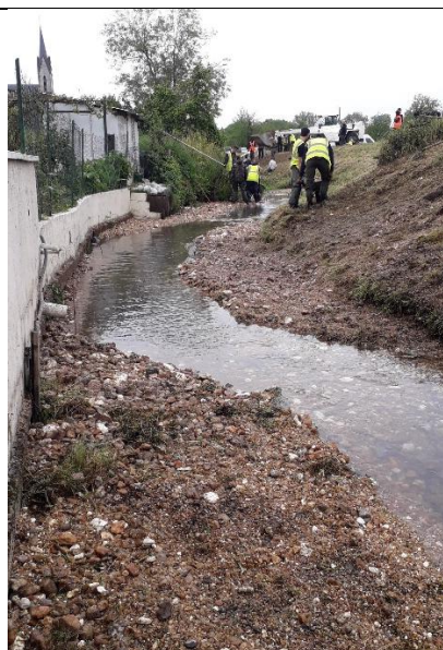
Tronçon amont après travaux