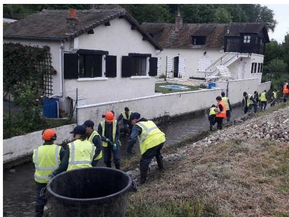
Tronçon amont avant travaux