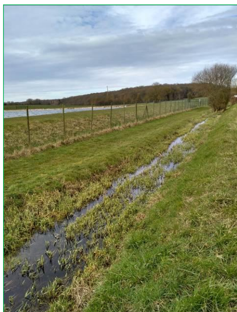
Partie aval avant travaux

Agence de l'Eau Loire Bretagne (60%) – Région Centre-Val de Loire (20%)