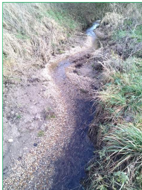
Radier du pont après