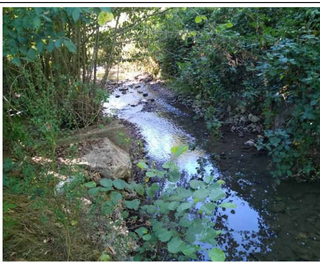
Seuil à planches après travaux