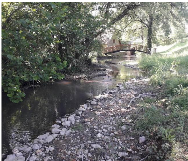
Tronçon amont après travaux