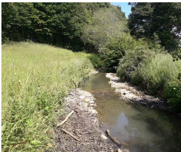
Tronçon aval après travaux