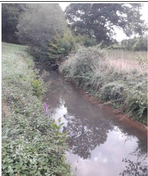
Tronçon aval avant travaux