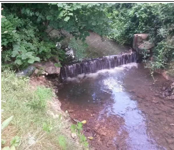
Seuil à planches avant travaux