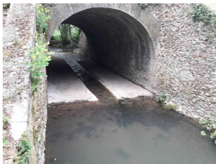
Radier du pont après travaux