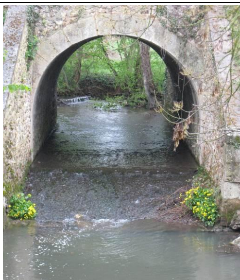
Radier du pont avant travaux

Agence de l'Eau Loire Bretagne (60%) – Région Centre-Val de Loire (20%)