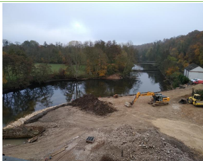
Photo après travaux