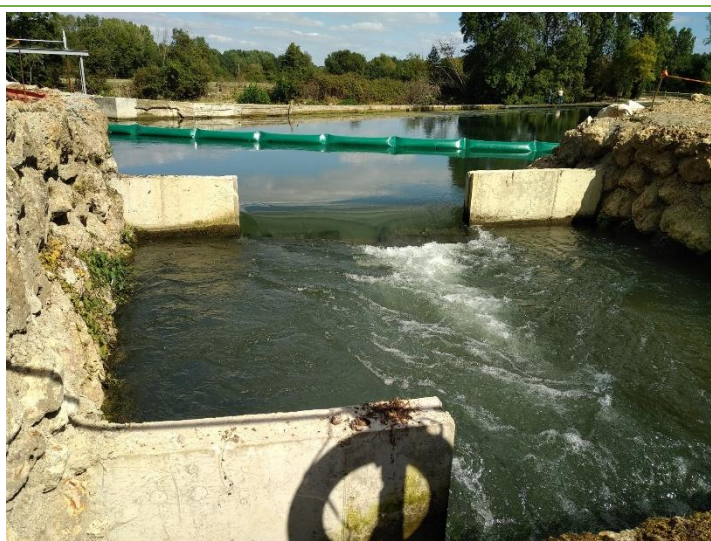
Passe à poissons

Partenaires financiers de l'opération : Agence de l'Eau Loire Bretagne (60%)