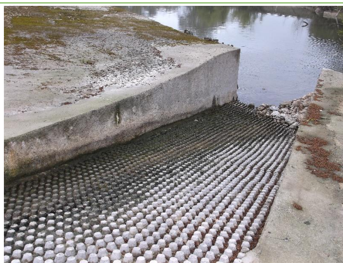
Rampe à anguilles