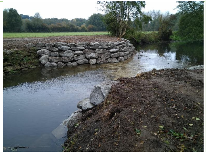
Seuil répartiteur après travaux