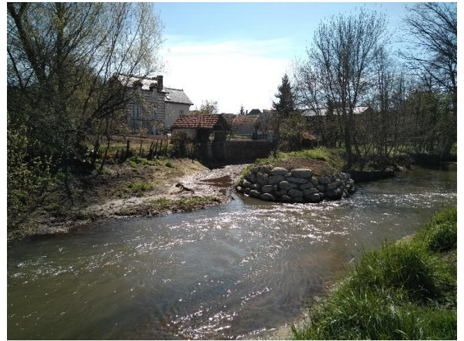
Vannage principal et bief après travaux