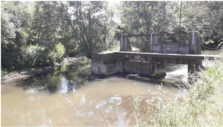
Vannage principal et bief avant travaux