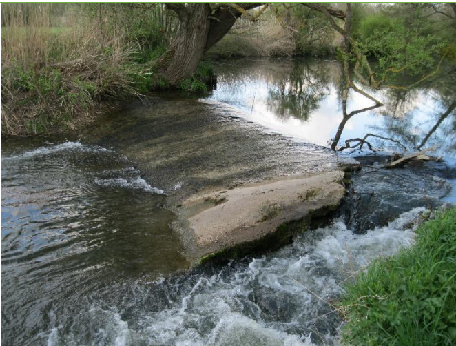
Seuil répartiteur avant travaux