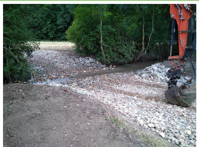
Photo après travaux