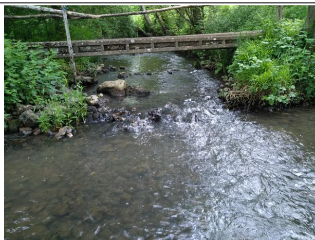
Photo du seuil après aménagement