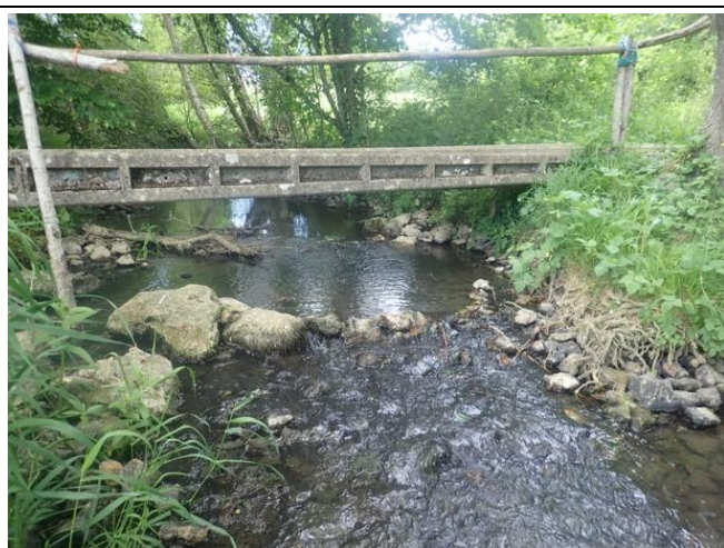
Photo du seuil avant aménagement

Partenaires financiers de l'opération : Travaux réalisés en régie