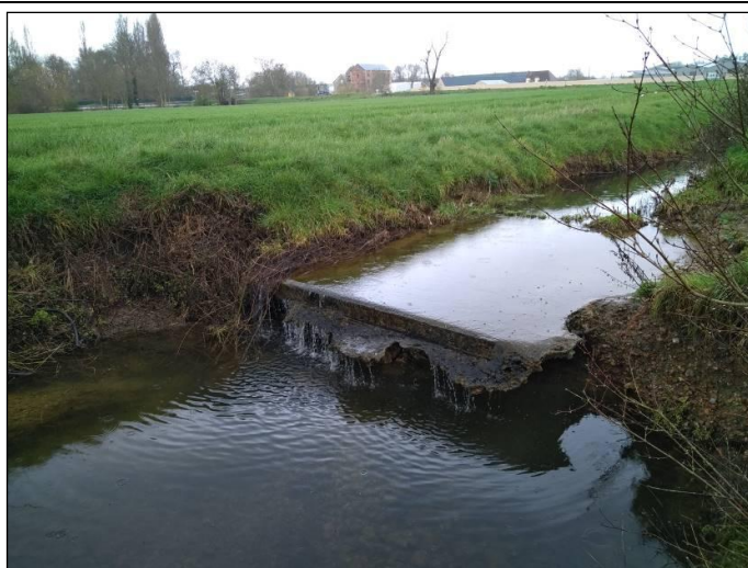
Photo du seuil avant travaux

Agence de l'Eau Loire Bretagne (70%) – Région Centre-Val de Loire (30%)