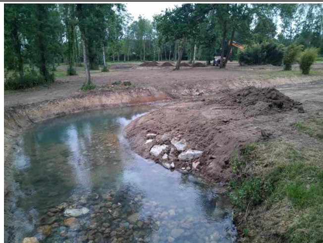
Photo après travaux