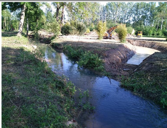
Photo de création du nouveau tracé