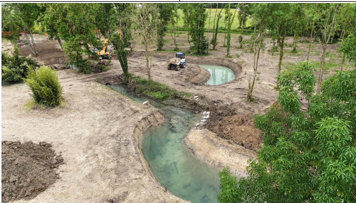
Prise de vue au cours des travaux