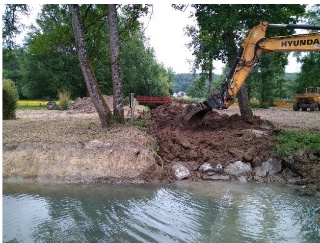
Photo de comblement de l'ancien lit