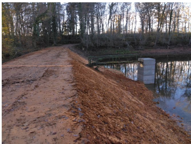
Photo de la digue et de l'ouvrage

Conseil départementale de Loir-et-Cher (30%)