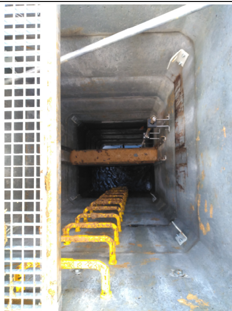
Photo de l'intérieur de l'ouvrage